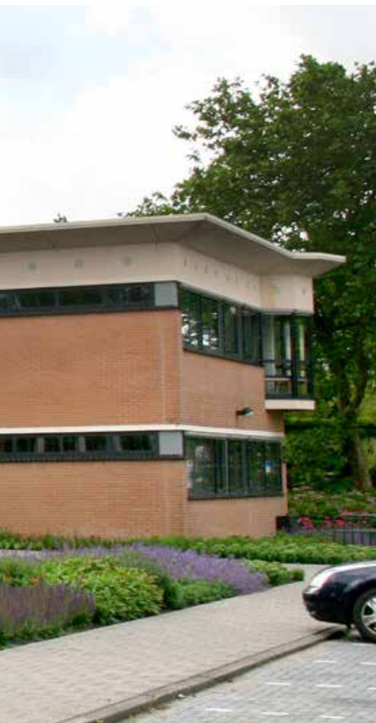
Bestuurscentrum gemeente Pijnacker