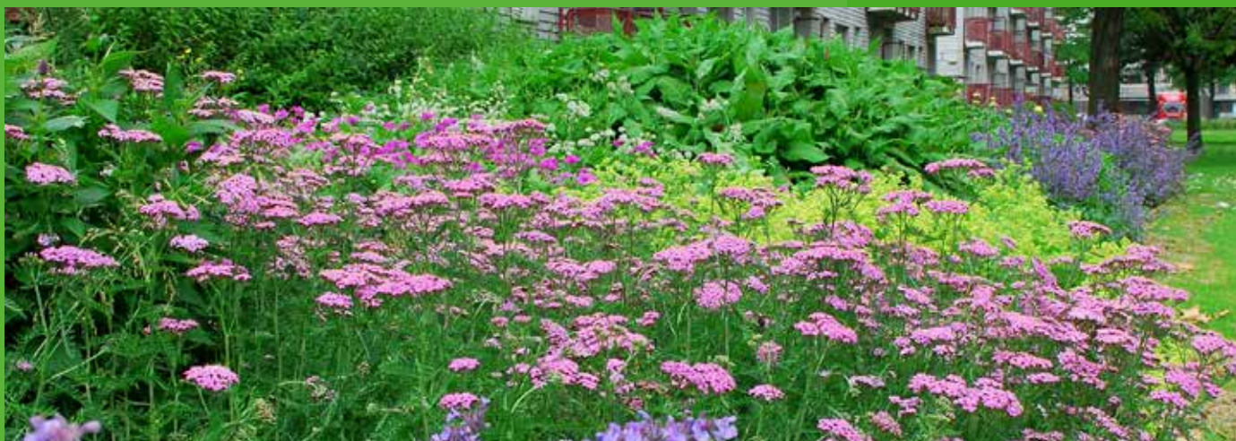
Vaste plantenborder Overschie Rotterdam