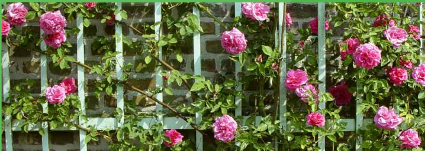
Geveltuin in stad